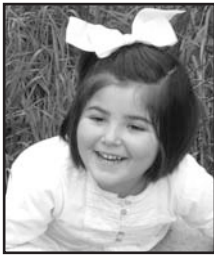
Maiatzak 24 Zorionak June zure 4. urtebetetzean. Musu handi bat etxekoan partez.