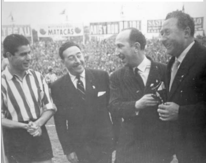
Athletic Clubeko Piru Gaiatzarekin batera Don Quijote saria jaso zuen.