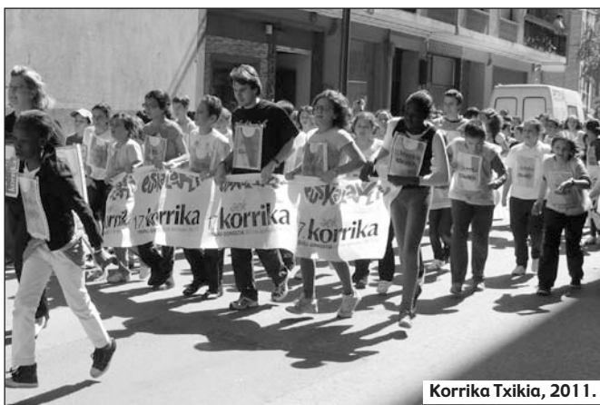
Korrika Txikia, 2011.

Dakienak ikasi nahi duenari irakatsi, ulertzen duenak hitz egiten duenari erabiltzeko aukera eman, agintariek herritar orori ikasteko bideak erraztu... Denok dugu zeresana eta zeregina. Euskara denona da eta denontzat izan