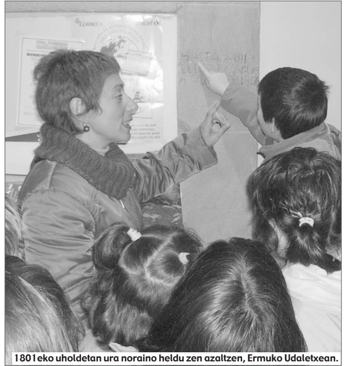
1801eko uhodetan ura noraino heldu zen azaltzen, Ermuko Udaletxean.

Begira, geografiak harreman estua du naturarekin: geografia fisikoa, animaliak, landareak, topografia, kli-