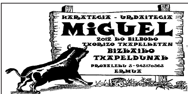
Drogeteniturrri, 208 zkia.

“Umeei ingurumena hurbildu behar zaie, esperientziak sortarazi. Ez dute sekula ahaztuko!”