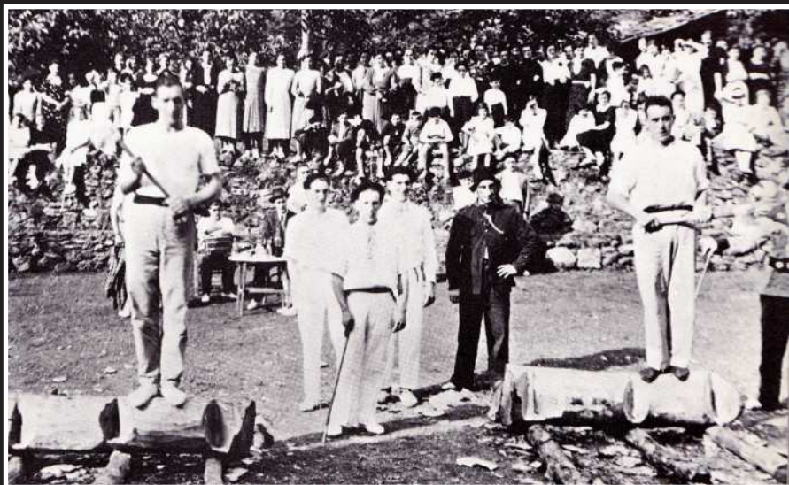
Iturria: "Egun Zaharretako Deba" liburua (1977ko otsailean kaleratua).

"Bereziki Lasturren eta Itziarren, gure kirol guztiak oso gogotsu egin dira. Kirol batzuetan zenbait indar-gizon lehen tokiak beteaz bereiztu dira. Nahiz eta debarrek ez duten toki garrantzirik bete aizkolaritzan, ohiturazko kirola dugu hori ere.