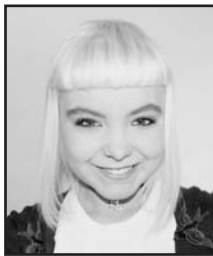
Abenduaren 19an Zorionak eta ondo pasa zure egunean. Musu handi bat etxeko guztien partez.