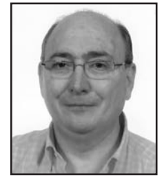
Abenduaren 21ean Zorionak Tio, jarraitu hain jatorra izaten eta musu handi bat etxekoaren partez.