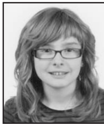
Uztailaren 28an Zorionak bikote, neskatila batzuk eginak zaudete!! Ondo pasa familia guztiaren partez.