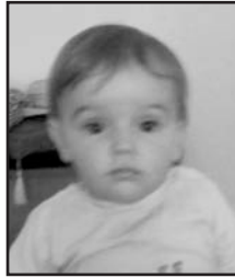
Uztailaren 12an Lur gure sorgintxoak urtetxo bat bete du. Patxo potolo bat danon partez.

Alemaneko klaseak ematen dira. Metodo atsegina eta adin guztietarako. © 670793312. Leire.