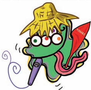
Euskal Birusa Elkartea

Lagundu nahi baduzu, deitu 688632874 telefonora