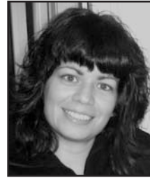
Uztailaren 15ean Zorionak! Muxu asko etxekoan partez.