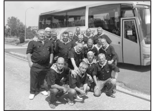
Ekainaren 2an, Urdiñak koadrilakoek urteroko txangoa egin zuten Errioxara.

Hurrengo zenbakirako azken eguna: UZTAILAREN 10a