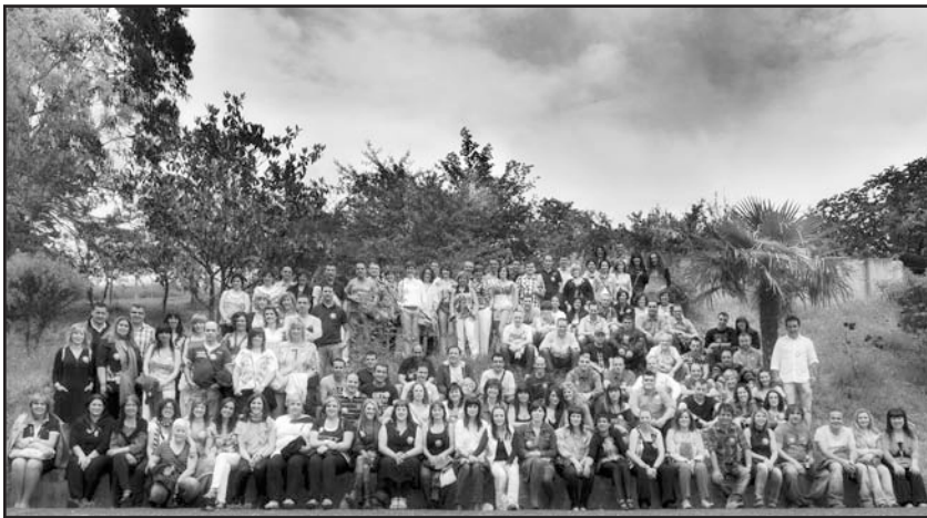
Ekainaren 9an 1972ko kintoek euren arteko aurreneko bazkaria egin zuten. 121 lagun bildu ziren, tartean Madril, Leon, Valentzia, Burgos eta Bartzelonan bizi diren ermuarrak ere. Goizean elkartu, Eguzkialde jatetxean bazkaldu, DJ batekin gozatu eta goizaldeko 5ak inguruan parrandari amaiera eman zioten gehienek Ermuan.