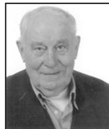
Ekainaren 7an Zorionak Ziriako zure 84. urtebetetzean etxekoen partez.

Hurrengo zenbakirako azken eguna: EKAINAREN 11