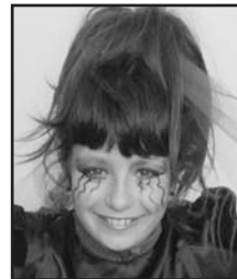
Apirilaren 7an Gure sorginari zorionik beroenak familia osoaren partez.