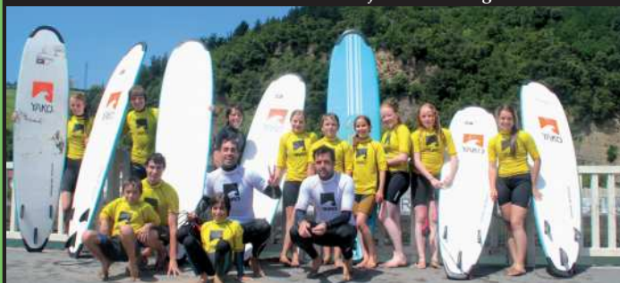
Kanpineko bisitariak, Yako Eskolarekin elkarlanean antolatutako surf ikastaroan.