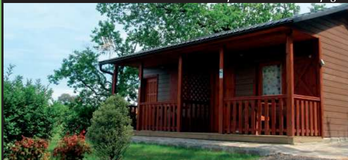
Aurtun jarritako bungalow berri bat.