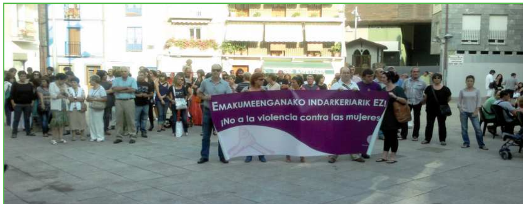
Abuztuaren amaieran egindako elkarretaraztea, Debako Udalak deituta. Santiagoko bidea egiten ari zen erromes batek Itziartik Debarako tartean jasandako ustezko sexu erasoak salatuz bertaratutakoek.

INDARKERIA da gure gizarteak gaur egun bizi duen arazo larrietako bat, emakumeek modu askotara jasaten duten indarkeria.