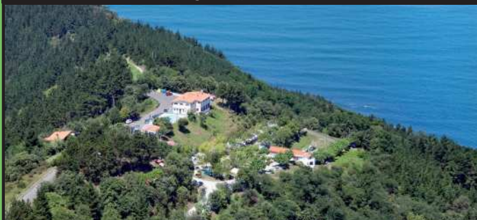
Kanpinaren aireko ikuspegia.

Itxaspe kanpina. Erreserbak eta informazioa: www.campingitxaspe.com/ 943 19 93 77.