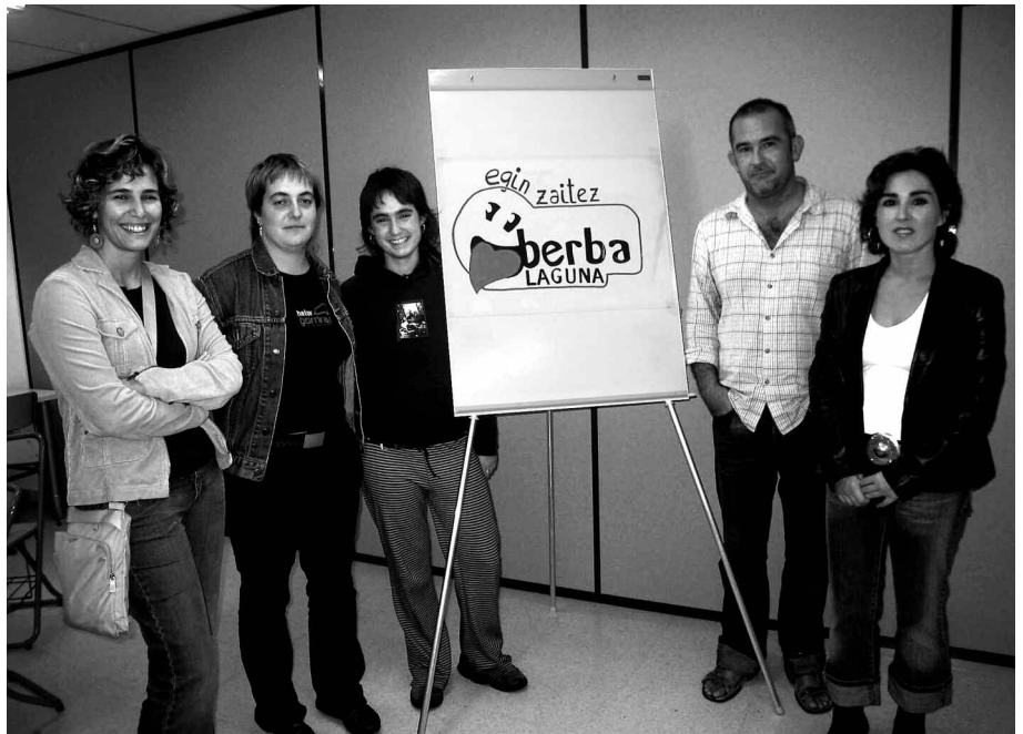
Pil-pilean, EHE, AEK eta Udaleko ordezkariak.

Euskara euskaltegitik kanpo erabili behar dutelako, eguneroko bizitzan normaltasunez, eta euskal komuni-