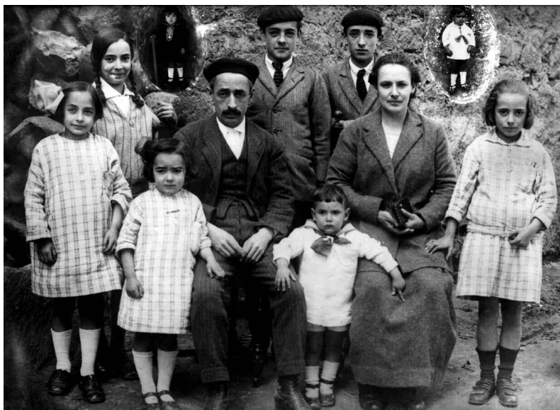
Iturria: Ana Sebal.