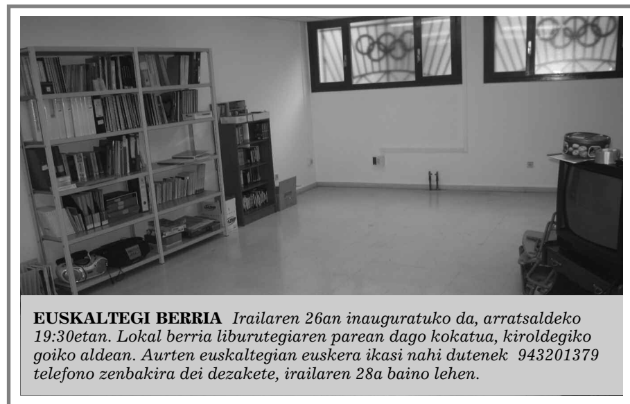
EUSKALTEGI BERRIA Irailaren 26an inauguratuko da, arratsaldeko 19:30etan. Lokal berria liburutegiaren parean dago kokatua, kiroldegiko goiko aldean. Aurten euskaltegian euskera ikasi nahi dutenek 943201379 telefono zenbakira dei dezakete, irailaren 28a baino lehen.

Ikasturte berria hastera doala eta, Abesbatzako zuzendaritzak koruan sartu nahi duten herritarrak animatu nahi ditu datorren asteetik aurrera ensaioetara etortzen has daitezen. Ensaioak Batzokiko lokaletan egingo dira, ostegunero (lehenengoa ostegun honetan, irailak 21) 20:15etatik 21:45era. Gaur egun 37 kantarik osatzen dute abesbatza, uztailean Kantarintxo gazte abesbatza batu zitzaientetik. Kurtso honetan proiektu berrietan sartuko da abesbatza.