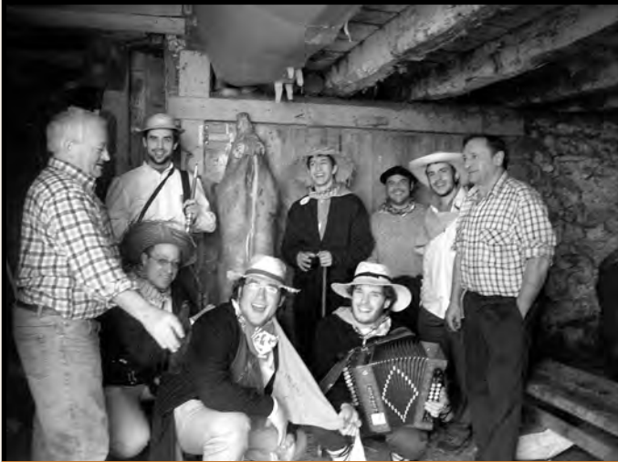
SANTA AGEDA ESKEAN