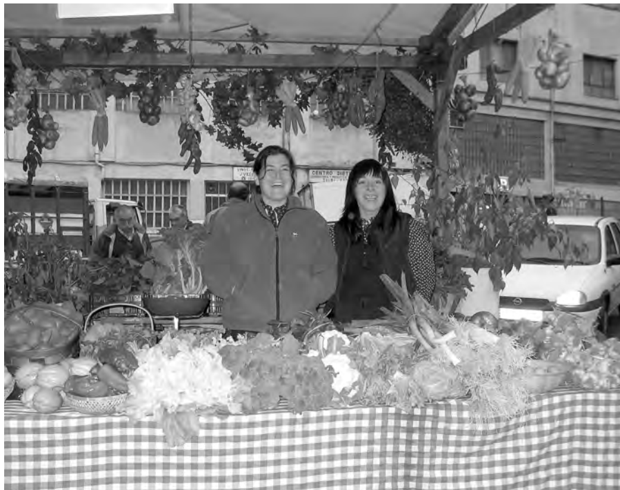
Obe baserriko aizpak barazki postuan.

Gaztañerre Azokak 10 urteko ibilbide arrakastatsua beteko du aurten. Hasieran baserritarren produktuak azaltzeko ekitaldi moduan hasi bazen ere urteen joanean jai giroko egun berezia ere bihurtu da.