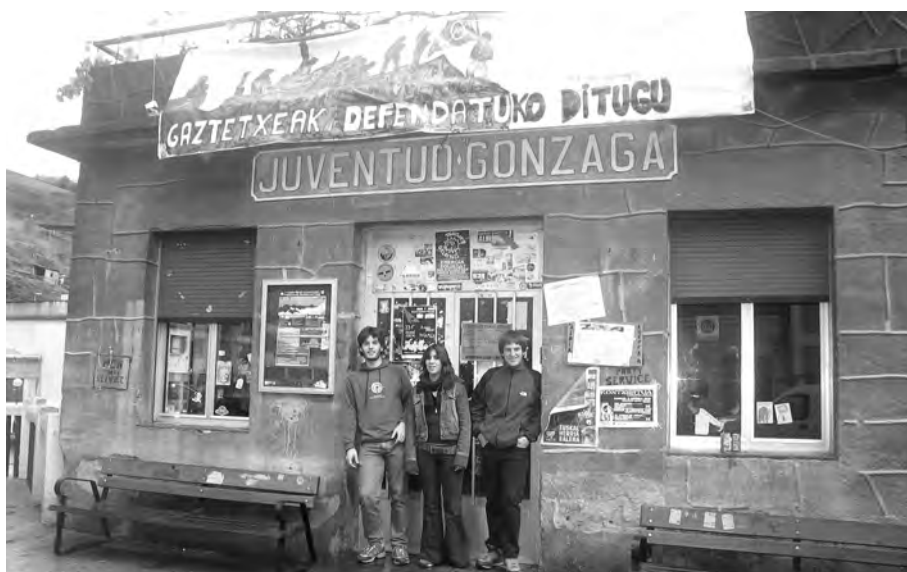
Gaztetxeari bizitasun handiagoa eman nahi diote gazteek.

“Soraluzeko Gaztetxea Mart-xan” izenburupian, Soraluzeko Gazte Asanbladak hainbat ekitaldi antolatu ditu azarorako. Honakoa da egitaraua: