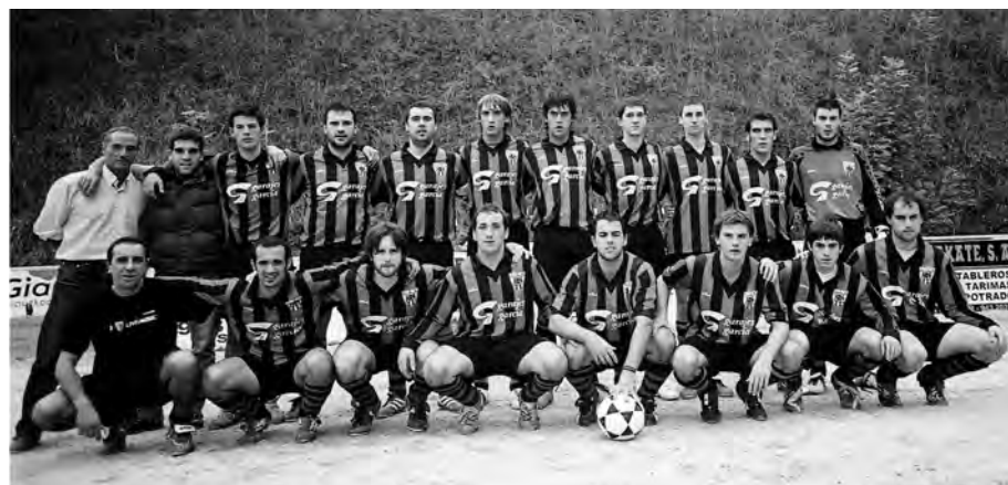
Soraluze F.T.ko erregional taldea.

denboraldi hasi berrian, 8 azken 2 partiduetan. Une hauetan sailkapeneko azkenaurreko tokian daude, 4 punturekin. Zapatu honetan Aretxabaleta liderraren bisita jasoko dute Ezoziko Futbol zelaian. Partidua 16:30etan hasiko da.