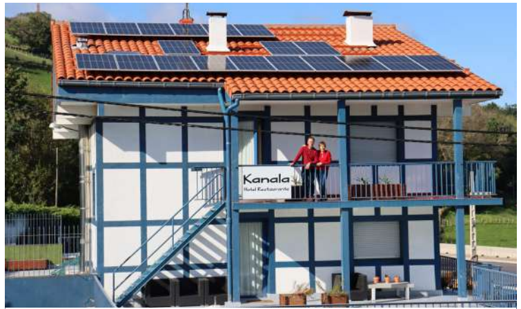
Plaka-fotovoltaikoak Itziarko Kanala jatetxean. DKT

Energia-kantitatea sistemaren tamainaren, kokapenaren, panelen inklinazioaren eta instalazioak jasotzen duen eguzki-argi kantitatearen araberakoa da. 1 kW-ko eguzki-panel tipiko batek Euskal Autonomia Erkidegoan 950 eta 1.400 kilowatt orduko (kWh) artean sor ditzake urtean, kokatuta dagoen eskualdearen arabera.