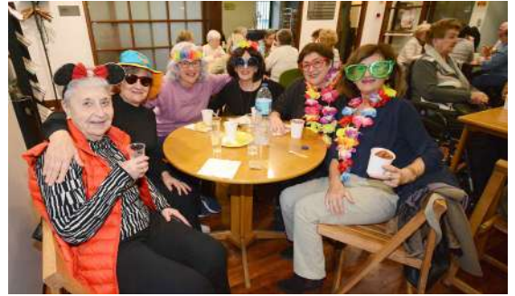
Ezkerrean, Gasteizera egindako irteera. Eskuinean, sukaldaritza tailerra (goian) eta inauterietako txokolate jana (behean). JOXERRA LARRAÑAGA

ikasturteko lehen jarduera, eta bertan parte hartu zuten hamalau lagunek Deba-Olatz-Mutriku-Deba ibilbidea egin zuten oinez; azaroaren 14an izango da hurrengo hitzordua.