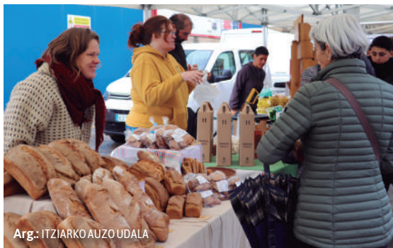
Arg.: ITZIARKO AUZO UDALA