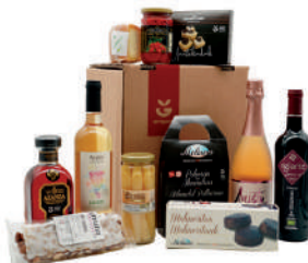
Saski gorria 75€