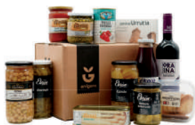
Saski beltza 55€