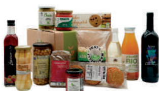
Saski berdea 65€ eko