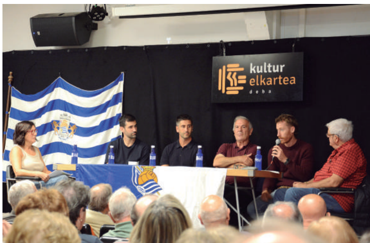
Realeko jokalaria ohiek mahai-ingurua egin zuten urriaren 17an. JOXERRA LARRAÑAGA

Zuzendaritza batzordean egindako lehen urtea errepasatzerakoan, Arbil Elkarte Sozialeko kideek azken hilabeteotan antolatu dituzten jarduerak nabarmendu dituzte, eta "irakurketa positiboa" egin dute. "Lan handia" egin duten arren, jendeak erantzun polita eman duela eta taldearen balorazio orokorra ona dela azpimarratu dute.