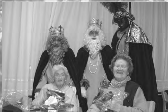
Hiru Erregiak erresidentzian izan ziran aittitta amameri bisita bat egiten. Negurako bufandak eta urte berrirako desiorik onenak eruan zituena erregalo. Iluntzian kabalgatan ibili ziran.