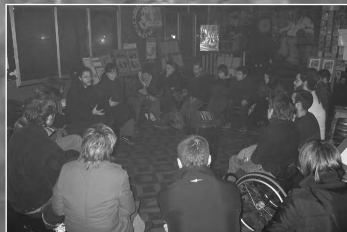
Gaztetxeako Hamabostaldixan partehartze haundixa izan da. Gartzelen Kontrako Astiaren barruan, gartzeletako egoera larrixaren inguruko hitzaldixa eskeini zeban Salhaketa-k.