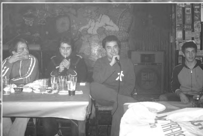
Iñuxente Eguneako Gaztetxeako Bertso Afarixan 40ren bat bertsozale batu ziran. Agirre eta Berrobirekin batera herriko bi bertsolarik bertsoz "mozkortu" zittuzten baztarrak.