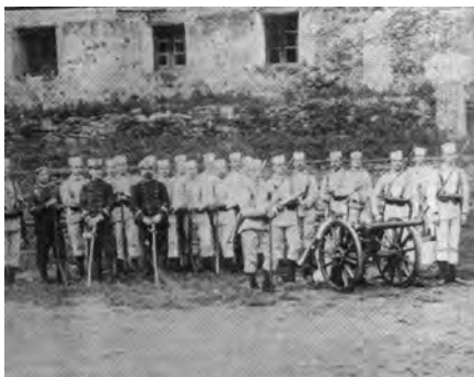
"Infanteria de Marina Destacamento de Placencia de las Armas" 1898 urtean

"Adituen arabera, XV. mende bukaeran hasi ziren plazentziarrak lehenengo su-armak egiten."