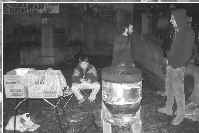
Aspaldiko partez, Gaztañerriak erosteko aukeria be izan da aurtan kalia. Erre ahala saldu ei dittue gaztainak. Datorren urterako Udaletxepian ipini bihar aterpe goxo bat...