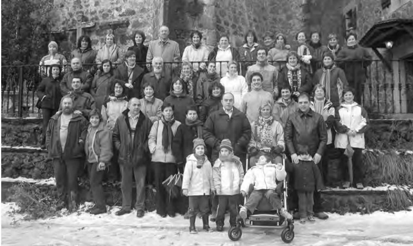
Oierri laguntzen diharduten bolondresetako batzuk Ezoziko plazako harmailetan Oierrekin batera.