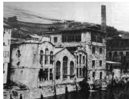
Euskalduna fabrikaren argazkia.

1862an errege-fabrika utzi eta merkatal-elkarte batek Euskalduna fabrika berria eraiki zuen (gaurko Kirolegia dagoen lekuan). Ondorengo urteetan atzerriko jabe desberdinak izan zituen fabrikak: 1888an Maxim Nordenfel Company limited firmak hartu zuen eta 1908an Vickers -ek (ingelesak). Azken honek gainera izen berria jarri zion fabrikari: The Placencia de las Armas company limited . Ingeles hauek izan omen ziren herrian "fooballian" egiten erakutsi zutenak ere.