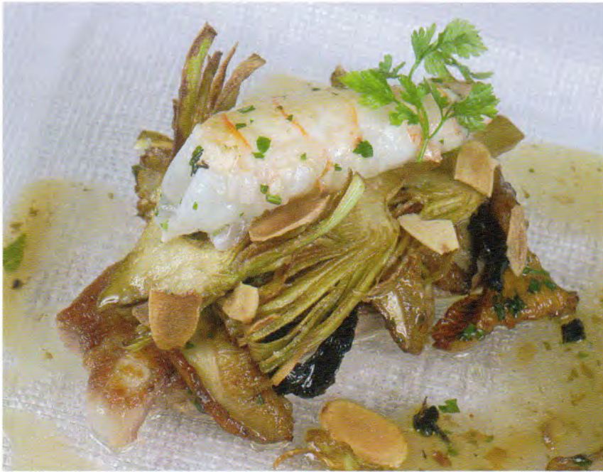
Alkatxofa frijituak txerri urdai, garaiko onddo, zigalaxo, zigarlatxo, arbendol txigortu eta udazkeneko zukuarekin. Tubal jatetxea