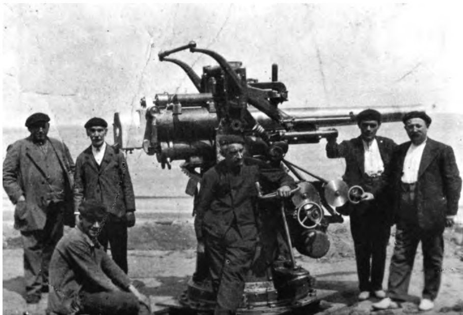
XX. Mendeko kañoi fabrikako probadoreak Debako hondartzan kañoia ri eusten.

Gerratean eta gerra osteko urte batzuetan fabrikako langileria militarizaturik egon zen, nahi edo nahi ez ejerzitoko militar bihurtuz. urte horietan 1000 bihargin baino gehiago hartzera heldu zen Soraluzeko lantokia eta Sociedade-ak lantoki berriak ireki zituen Andoainen eta Beasainen. Azken urteetan produkzioa Andoaingo izen bereko lantegira eraman dute etengabe, aurten langileak ere eraman dituzten arte. Horrela amaitu da Plazentziako ofizioa, kittedo 5 mendetako historia, museo, erakusketa edo aztarma askorik utzi gabe, ixil ixilik, ia-ia tiro hotsik gabe.