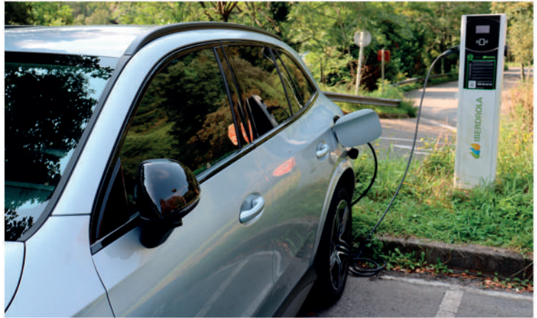
Auto elektrikoentzako kargalekua Azitaingo industrialdean (Eibar).

Espainiar estatuan, lau plazako auto elektrikoak merkeak 18.000 euro ingurutan saltzen dira, batzuek besteak, berriz, 34.000 euroren bueltakoa da. Baina auto elektrikoaren kostua kalkulatzeko garaian, beste