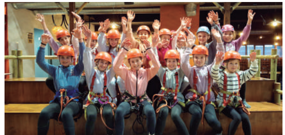
Zuhatza-Kolore Anitzek Bizkaia Park Abenturara egindako irteera.