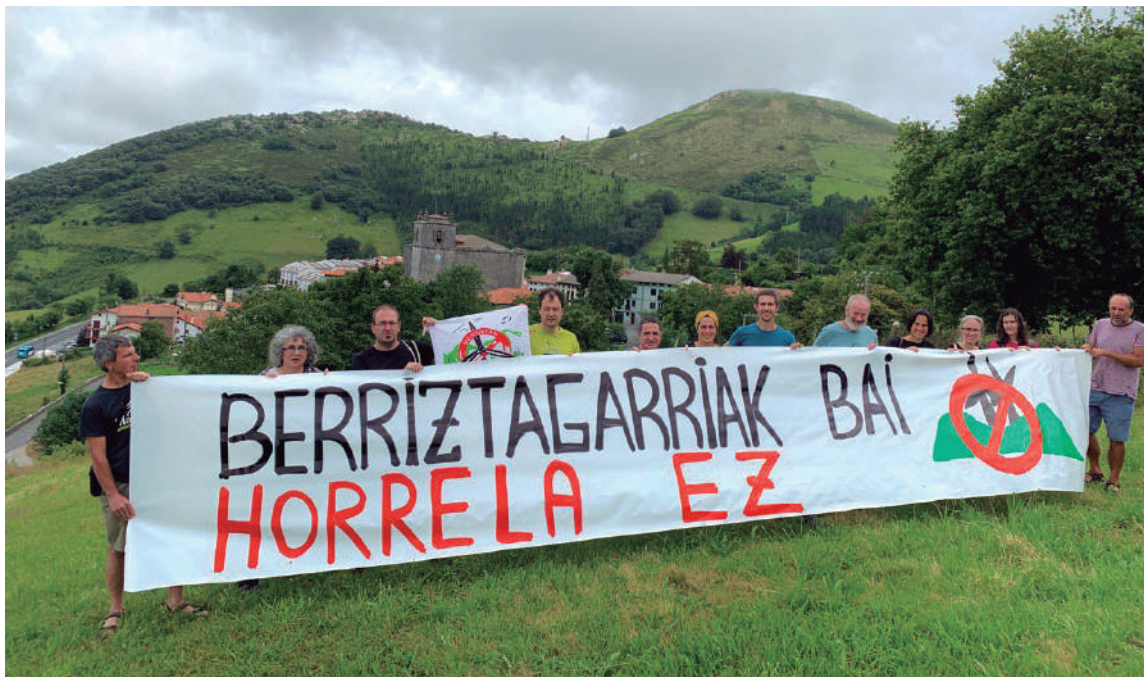
Lurralde Plan Sektorialari alegazioak aurkezteko deia eginez, Gipuzkoako Mendiak Aske plataformako kideak Itziarren batu ziren 2023an. GMA

saguzarrak ( Miniopterus schreibersii ), Bechstein saguzarrak ( Myotis bechsteinii ) eta Ferra-saguzar mediterraniarrak ( Rhinolopus euryale ).