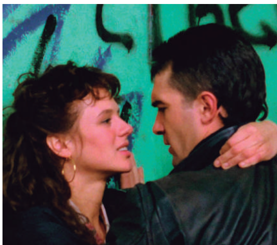
'La blanca paloma' filmeko fotograma bat.

Ikusi Deban grabatutako irudiak: labur.eus/antoniobanderasdeba