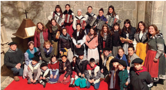
Gabon eskea Itziarren.