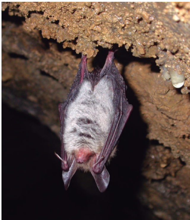
Bechstein saguzar bat.