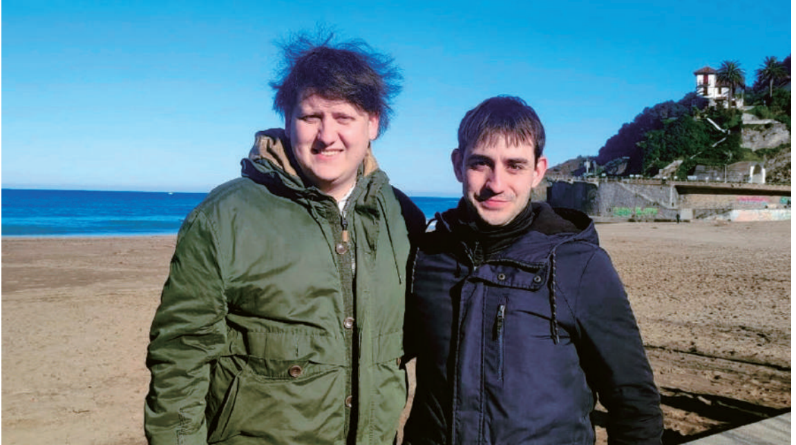
Aranberri eta Sagarna Tene Mujika bekaren irabazleak. ELKAR