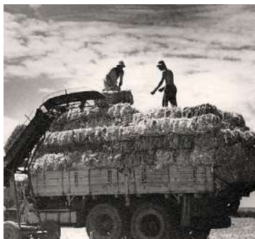
1950eko hamarkadako kibbutzen argazkiak.

izan da: gai interesgarri bat geneukan, aktualitatearekin lotura zuzena duena, eta, era berean, aurrez landu gabea. Guk ikerketari heldu diogu, topatutakoa kontatzeko, bestelako anbiziorik gabe. Pentsa, mezua helarazi ziguten uanean, lehenbizi, badaezpada, elkarri idatzi genion, inor txantxetan ez zebilela egiaztatzeko!