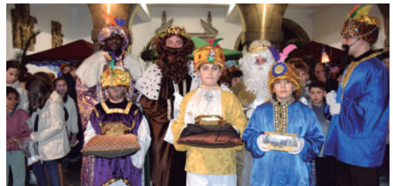
Debako Errege Magoen kabalgata.